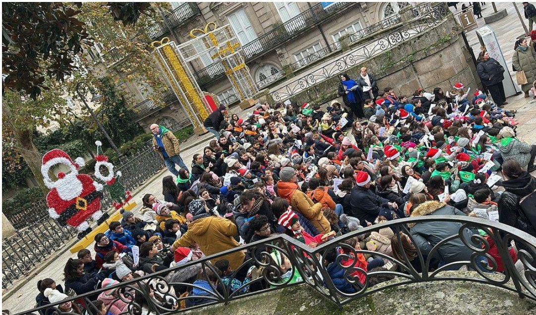
Sembradores de Estrellas en Ourense

Los ‘Sembradores de estrellas’ vuelven a anunciar la Navidad un año más. Miles de niños salen en estos días a las calles a repartir estrellas en nombre de los misioneros. Además, ellos mismos se convierten en misioneros en su ciudad, anunciando la buena noticia de que Jesús nace para todos. Con ellos comienza la campaña de Infancia Misionera, que implica a los niños en la misión de la Iglesia –con un concurso nacional de dibujo, manualidades, catequesis-, y que culminará con la celebración de su Jornada, el próximo 18 de enero.