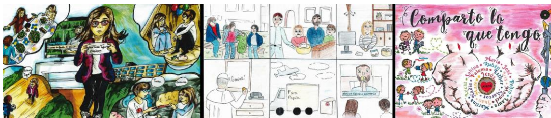
Dibujos ganadores de la categoría de los mayores