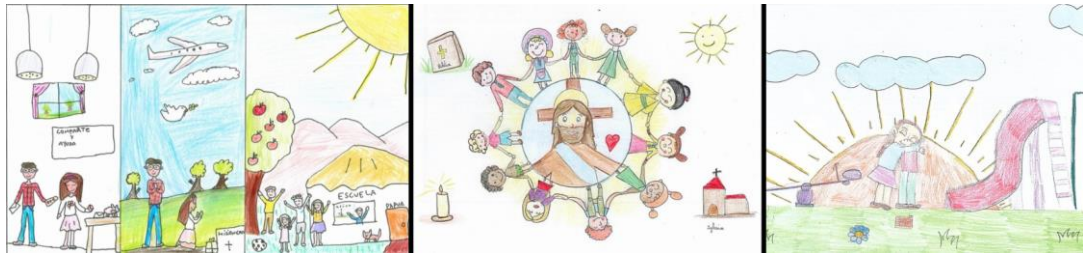
Dibujos ganadores de la categoría de los pequeños