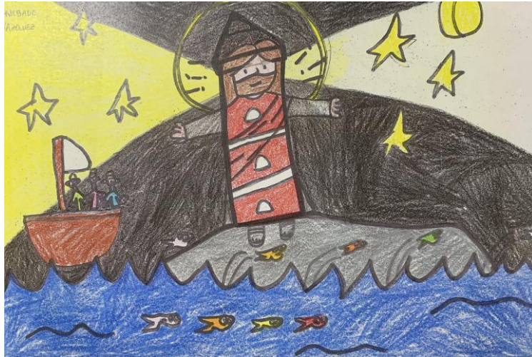
Dibujo ganador de la categoría de los pequeños